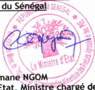
Maître Ousmane NGOM Ministre d'Etat, Ministre chargé des Mines

Pour le Gouvernement de la République du Sénégal